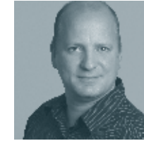
Dipl.-Ing. Mario Munz alsh sander.hofrichter architekten GmbH, Gesellschaft für Architektur und Generalplanung, Ludwigshafen

15.00 Uhr Wie wird BIM im Klinikbau eingesetzt?